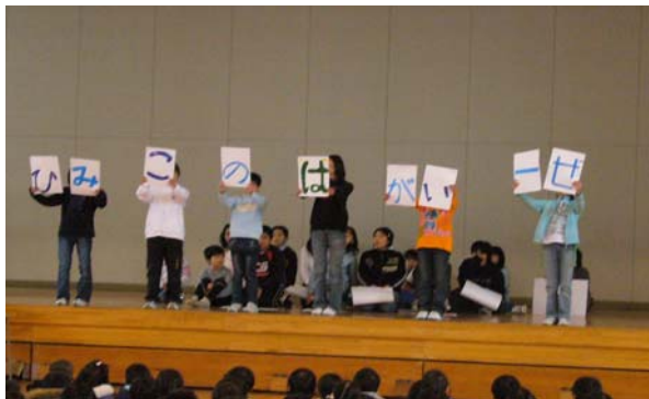
[ 佐久市中佐都小学校での実施風景 ]

学校歯科医、歯科衛生士、養護教諭をはじめ学校の先生方の協力により「こども8020推進員ノート」に基づく学習と、各校で創意工夫した講義を実施しています。大人になっても「歯の大切さ」を意識し、いつまでも健康を保つために「歯の健康管理」を継続して欲しいと願って、認定書とバッジを交付しています。