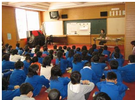
[ 飯山市立飯山小学校での実施風景 ]

内容詳細については、8020推進だよりNo.5 及び 信州歯報3月号(第527号)に掲載されています。