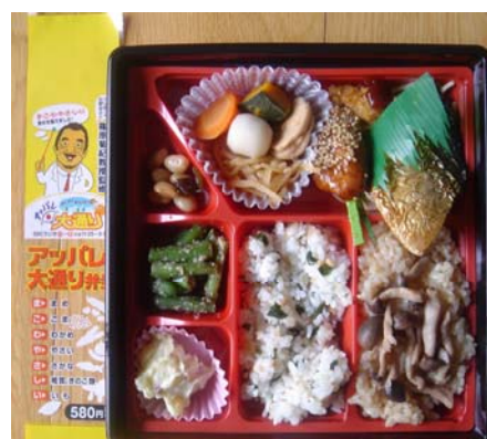
食育を考えたお弁当「アップレ大通り弁」

そしてもう一つ、「よく噛む」ことが重要です。よく噛むことにより満腹感が得られ肥満を防ぐ、脳の働きを活発にするなどの効果もあり、そのためには健全な歯と口腔機能が必須と考えます。日頃からの口腔ケアも見直し (長野県歯科医師会地域保健部)